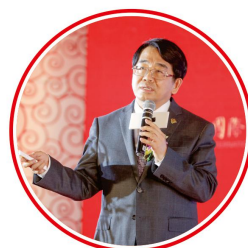
中国科学院院士、俄罗斯科学院外籍院士、亚太工程组织联合会主席黄维