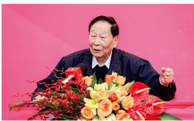
周长琦：文化要跟时代结合