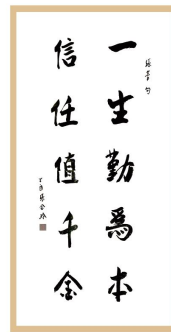
原文化部高占祥部长为深圳孔子文化节题写贺词